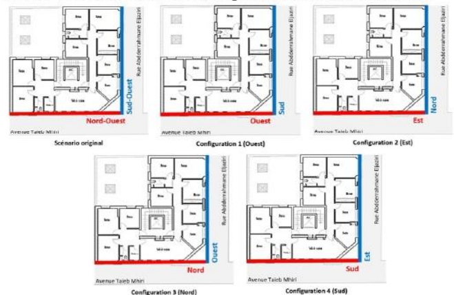
Fig. 4. Modification de l'orientation de l'immeuble contemporain étudié

Le bâtiment initial, étant d'angle, est orienté Nord-Ouest et Sud-Ouest. Dans le but d'approfondir notre recherche, nous avons tenté d'étudier l'impact des dispositifs d'ombrage selon l'orientation. Pour ce faire, nous avons modifié l'orientation du bâtiment, et ce, suivant les quatre directions cardinales.