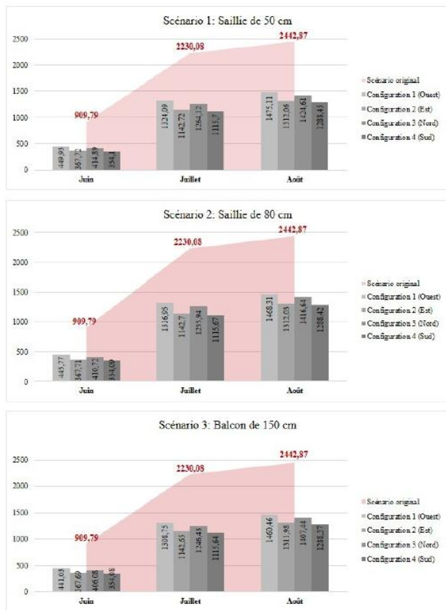
Fig. 5. Impact de l'ajout des protections solaires sur la consommation d'énergie suivant les quatre configurations d'orientation (en kWh)

La figure 5 donne les résultats relatifs à l'impact de l'ajout de dispositifs d'ombrage de différentes largeurs sur la consommation d'énergie, et ce, suivant les quatre orientations. Ces résultats mettent en exergue le pouvoir optimisateur d'énergie de ces dispositifs. Il en ressort, qu'en période estivale, et ce, à n'importe quelle orientation, plus la protection est large plus celle-ci est efficace.