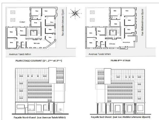
Fig. 1. Les éléments graphiques de l'immeuble étudié

L'immeuble de bureaux étudié se situe au centre-ville de Tunis; capitale de la Tunisie. Etant un immeuble d'angle, celui-ci se trouve à l'intersection de l'avenue Taieb Mhiri (au Nord-Ouest) et de la rue Abderrahmane Eljaziri (au Sud-Ouest).